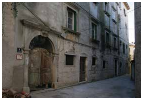
Palača Moise, Cres

Dvigrad je napušteni srednjovjekovni grad u kojemu se nalaze ostaci oko 180 kuća, dobro očuvani gradski bedemi s tri obrambene kule i troja gradska vrata. Impresivnošću ruševina te nenarušenim krajobrazom s brojnim sakralnim objektima i arheološkim lokalitetima u neposrednoj blizini, Dvigrad je postao turistički atraktivna lokacija. U planu je organiziranje Dvigrada kao multidisciplinarnog znanstvenog centra u kojem bi se kroz terenski rad i stručna predavanja obrazovali budući stručnjaci iz područja arheologije, povijesti umjetnosti, povijesti, arhitekture, građevine, geodezije i konzervacije.