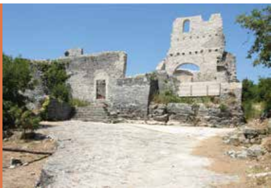
Ruševine starog grada Dvigrada

Dvigrad je napušteni srednjovjekovni grad u kojemu se nalaze ostaci oko 180 kuća, dobro očuvani gradski bedemi s tri obrambene kule i troja gradska vrata. Impresivnošću ruševina te nenarušenim krajobrazom s brojnim sakralnim objektima i arheološkim lokalitetima u neposrednoj blizini, Dvigrad je postao turistički atraktivna lokacija. U planu je organiziranje Dvigrada kao multidisciplinarnog znanstvenog centra u kojem bi se kroz terenski rad i stručna predavanja obrazovali budući stručnjaci iz područja arheologije, povijesti umjetnosti, povijesti, arhitekture, građevine, geodezije i konzervacije.