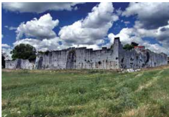
Jusuf Maškovića Han, Vrana

Kompleks svratište za karavane, u sklopu Parka prirode Vransko jezero, najznačajniji je spomenik otomanske arhitekture u Dalmaciji, a vjerojatno i u Hrvatskoj. Zahvaljujući sredstvima osiguranim iz IPA fonda, kompleks je u procesu obnove, revitalizacije u višenamjenski kompleks s malim hotelom, gostionicom, info centrom Parka prirode Vransko jezero, prodavaonicom lokalnih proizvoda i izložbenim prostorom. Projekt obnove Maškovića hana omogućio je suradnju i razmjenu iskustava regionalnih stručnjaka za otomansku arhitekturu. Revitalizacija hana dugoročno će jamčiti daljnji razvoj lokalne zajednice.